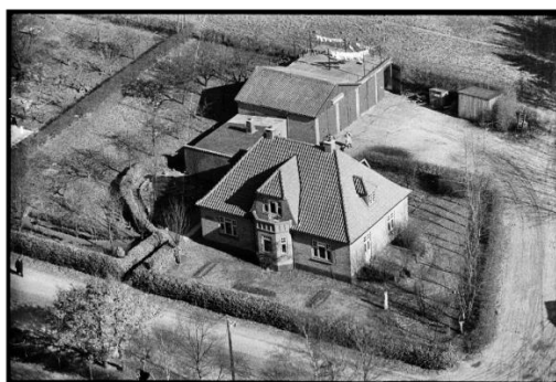
Egetoft set fra luften i starten af 1950'erne.

Hvordan klarer Omnibussen til Hald sig? – Vi må nu nøjes med at køre med een Vogn, men foreløbigt gaar der ogsaa, idet vi kan tage Gummien fra et par opklodsede Vogne vi har. – Hvordan ordnes Fordelingen af Dækkene? – Hvert Amt faar tildelt et antal Dæk. Viborg Amt har faaet 9 Dæk; men vi aner ikke noget om, hvorlænge det varer, inden vi igen faar nogle. – Hvordan fordeles de saa? – Foreningen og Rutebiludvalget uddeler dem saaledes, at de der trænger haardest, faar først. Situationen er alvorlig for hele Landet, og det varer sikkert saa længe, inden Rutebiltrafikken gaar i staa mange Steder, hvor man ikke mere kan tage Dæk fra andre, opklodsede Vogne.”