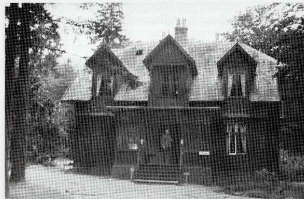
Fig. 3: Efteråret 1944. "Hexenhaus/Brocken". Søvillaen, hvor de kvindelige stabshjælpere i slutningen af krigen boede. Tidligere havde de fleste haft kvarter på Husholdningsskolen inde i byen, men afsikkerhedshensyn blev de hentet hjem på Badet.

I 1894 udvidedes Badet med den lille villa Granly til isolering af alvorligt syge, og forskellige liggehaller, musiktribune, tennisanlæg og andre sociale foranstaltninger kom til i de følgende år.