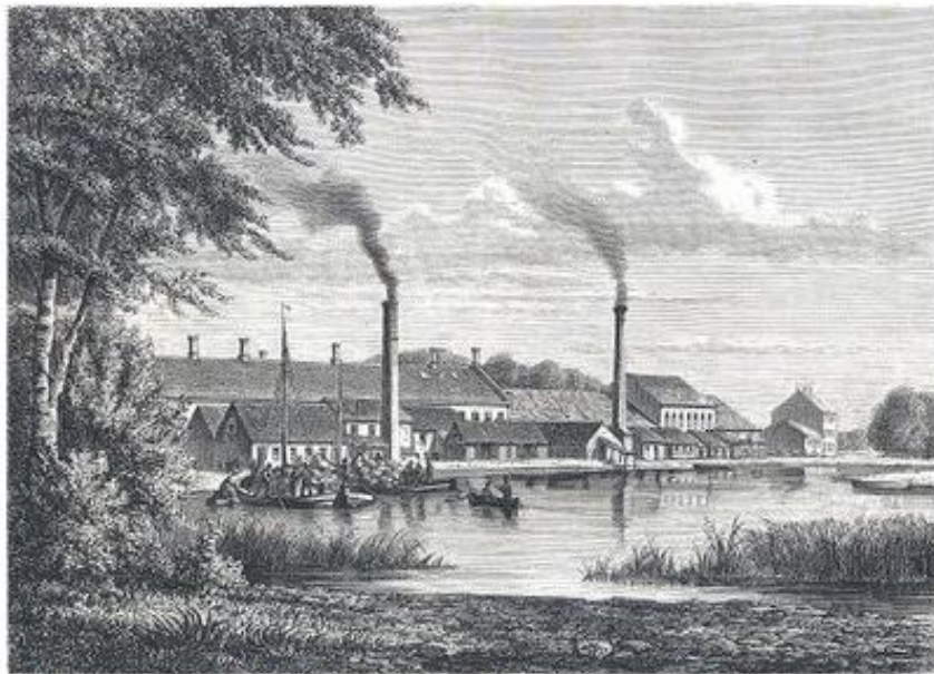
Silkeborg Papirfabrik 1864. Stik efter tegning.

Med Drewsens initiativer og ambitioner blev Silkeborg Papirfabrik efterhånden landets hovedcenter for produktionen af papir, og efter datidens målestok var fabrikken en stor og moderne fabrik med den nyeste teknologi. På Silkeborg Papirfabrik blev landets første vandturbiner eksempelvis taget i brug.