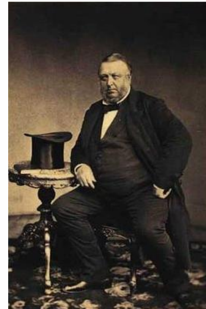
Fotografi af Michael Drewsen.

I dag står en statue af Michael Drewsen på Silkeborg torv, der hylder ham som byens grundlægger.