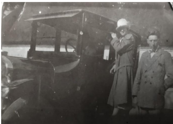
Min mor og far ved Ford T'en.

Min mor fik en Ford T på sin 18-års fødselsdag