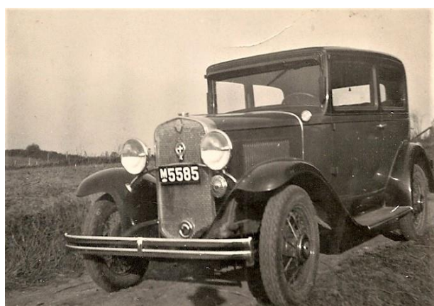
Ford T'en blev afløst af denne Pontiac fotograferet hjemme ved gården