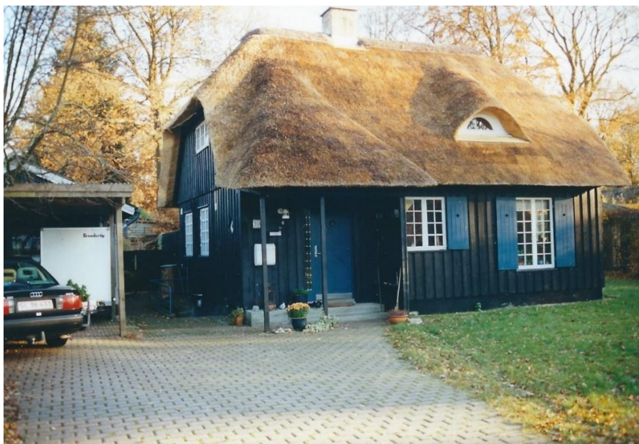
Ja I kender det det smukke hus på Egeskovvej 39