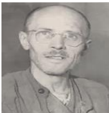
Udbryderkongen Carl August